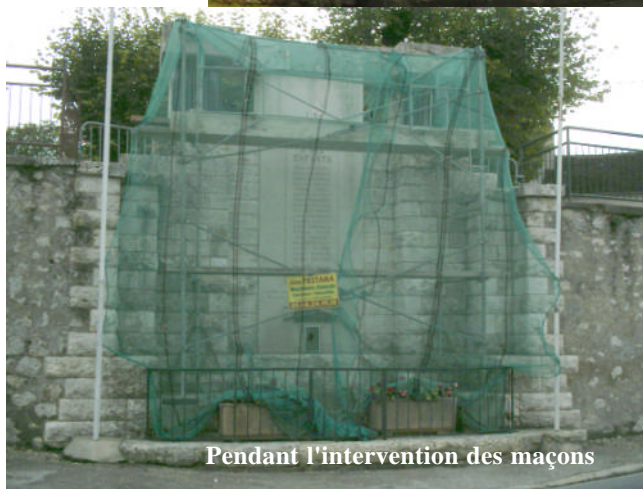
Pendant l'intervention des maçons

... à ces mêmes camions qui "grillent" les STOP et "Feux rouges" de la commune !