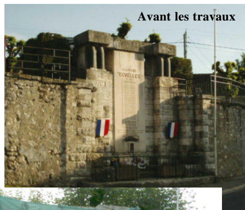
Avant les travaux

(Quelques travaux de finition sont encore attendus)