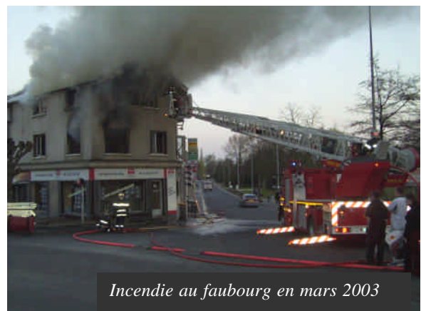
Incendie au faubourg en mars 2003