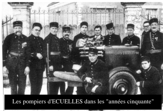
Les pompiers d'ECUELLES dans les "années cinquante"